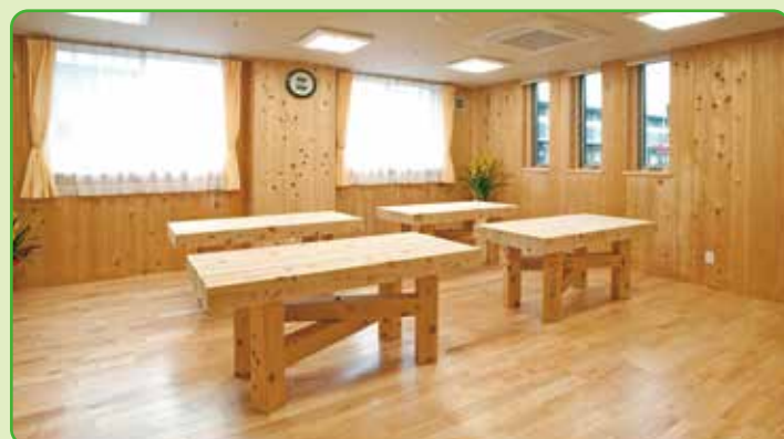
地域交流室 地域の方に無料でご利用いただけるスペースです。会合や勉強会また様々な趣味の講座や発表会等にもご利用下さい。